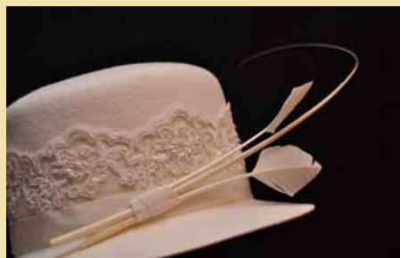
ÅSHILD OMA SELE